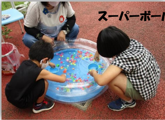
スーパーボールすくい