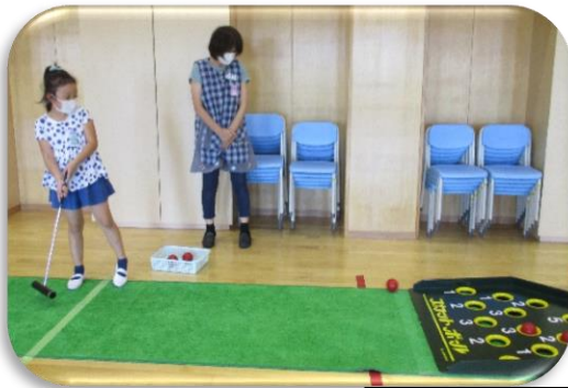
ニュースポーツに挑戦!