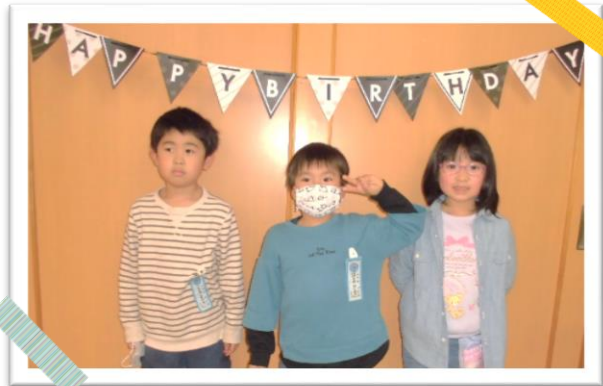
3月生まれさんお誕生日おめでとう♥