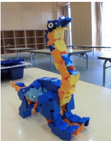
【夏休みにラQで作りました！】