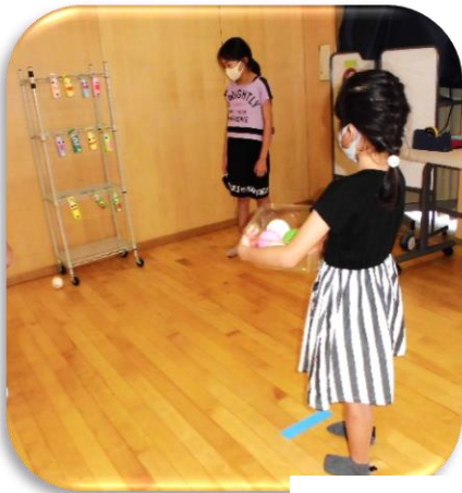
おぼけのまとあて