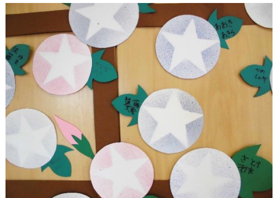
【あさがおのスパッタリング】