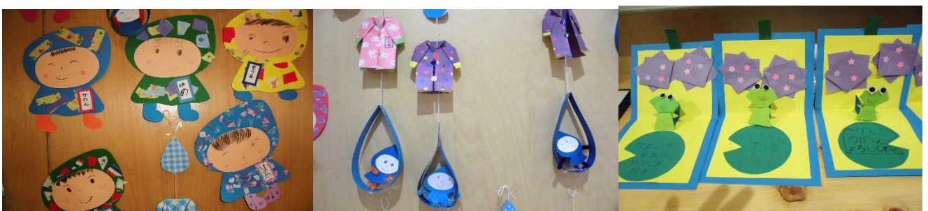
【あじさいとかえるのカード】