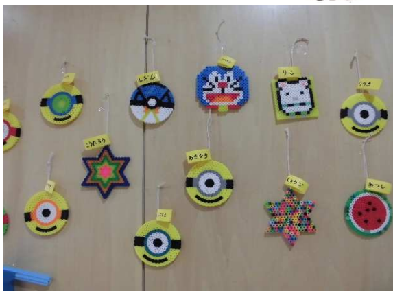
アイロンビーズでキャラクターや星、ハートなど作りました。