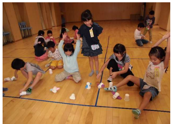
紙コップロケット発射！

秋休み以降3月まで、学校の下校時刻に合わせて、1人帰りの時間は16:00までとなります。兄弟のお迎えや習い事に出かける場合も同様となります。ご協力よろしくお願いします。